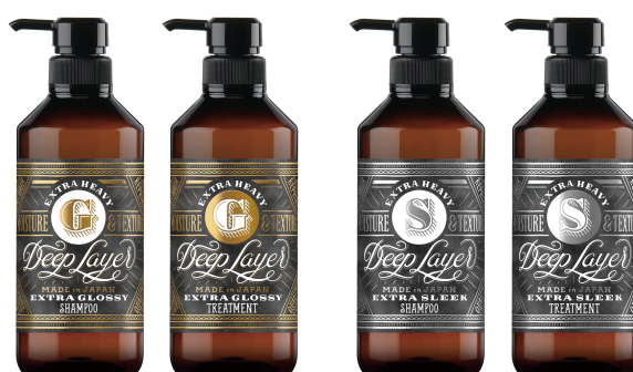
バイオマスボトルを使用